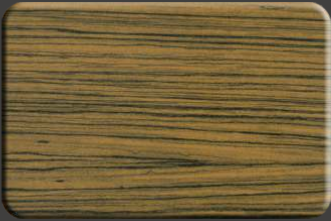
Light Wenge EX.