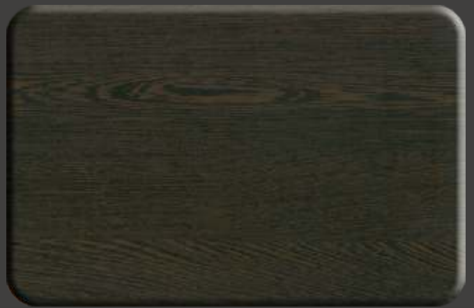
Dark Wenge EX.