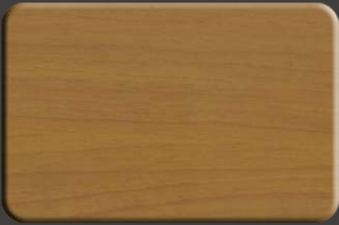
English Cherry EX.