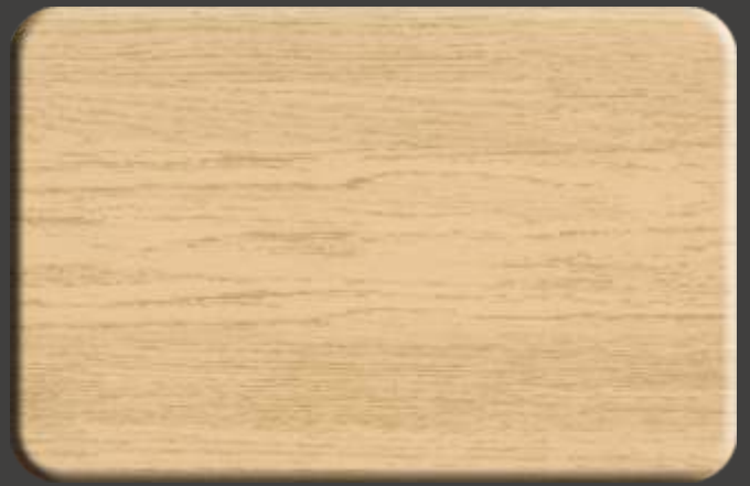
Elegant Oak EX.